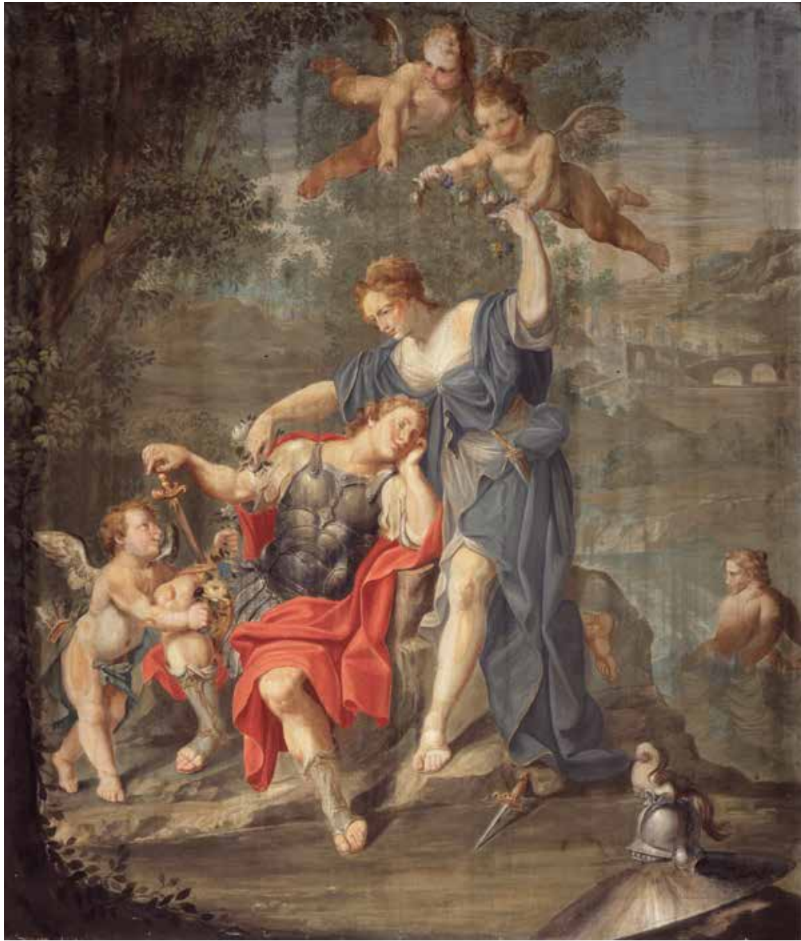
11. Giuseppe Marchesi, Armida si innamora di Rinaldo , Collezione BPER, Modena