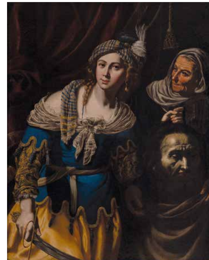
1. Onofrio Palumbo, Santa Caterina d'Alessandria , Collezione BPER, Avellino

predilige una composizione in cui la protagonista biblica è rappresentata in posa frontale anziché diagonale. La chioma è coperta da un fazzoletto a righe, che lascia in evidenza da un lato una treccia, dall'altro l'orecchino di perla di lontana memoria caravaggesca, così come il pesante tendaggio di fondo, qui arricchito da un cordone dorato terminante in una nappa (il riferimento è al dipinto di Caravaggio di uguale soggetto oggi a Roma, Galleria Nazionale d'Arte Antica, Palazzo Barberini). L'abito blu e giallo oro, con le maniche ornate da preziosi dettagli da-