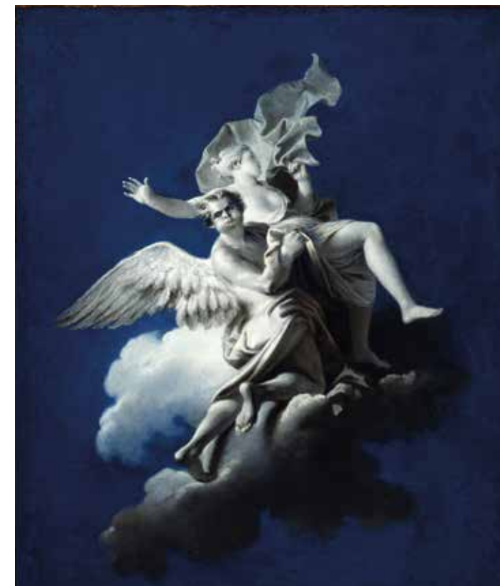
4. Domenico Guidobono, Borea rapisce Orizia , Collezione BPER, Genova