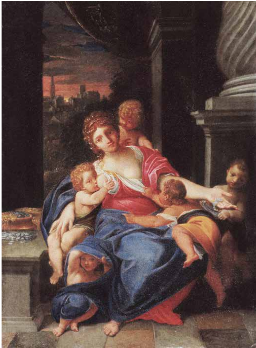
15. Ludovico Carracci, Allegoria dell'Abbondanza , Collezione BPER, Modena

di gesti che disegnano opposte diagonali e proiettano la fanciulla verso lo spettatore. La materia pittorica, ora sapientemente chiaroscurata, ora diafana e lievemente cangiante, accompagna con frizzanti tocchi di pennello la grazia delle figure, in un contrappunto di movenze che si svolgono nello spazio come in una danza al suono di una melodia musicale. La giovane sembra quasi invitarci a entrare nel suo spazio effimero fatto di colori cangianti e chiaroscuri vaporosi, in un continuo scambio tra realtà e finzione: uno stupefacente artificio barocco di forme trasfigurate in concetti astratti che suscitano meraviglia ma che, al contempo, diventano metafore del confine labile tra il gioco e la riflessione, tra divertita allusione e monito severo, facendoci meditare sulla fugacità della vita.