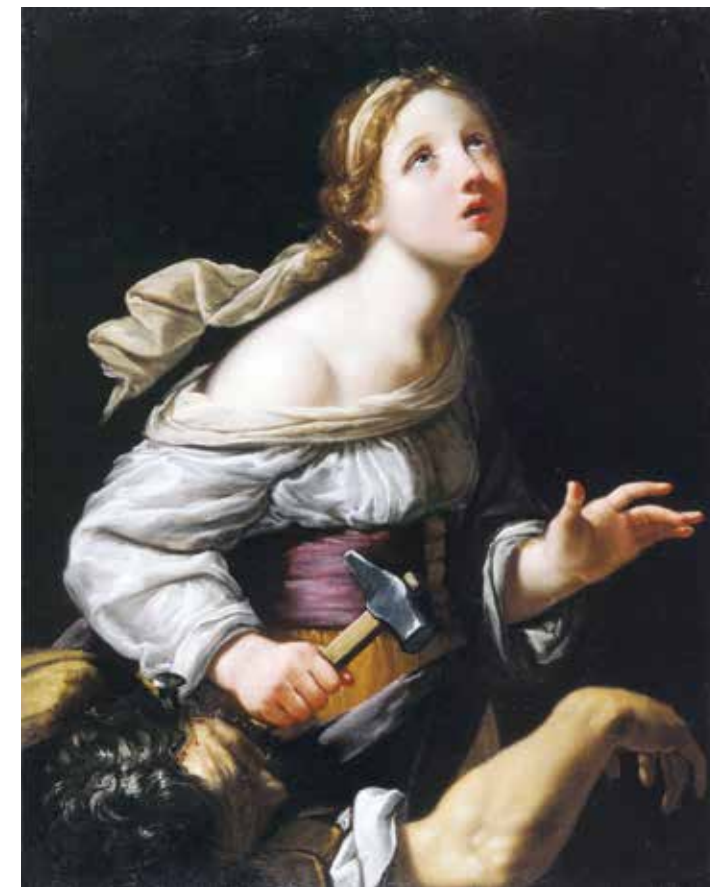
5. Paolo Emilio Besenzi, Giaele uccide Sisara , Collezione BPER, Modena