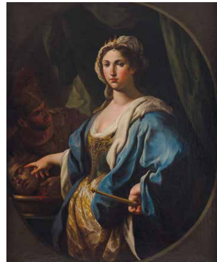
7. Sebastiano Conca, La regina Tomiri e la testa di Ciro , Collezione BPER, L'Aquila