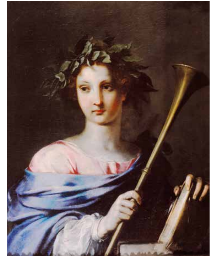
13. Gaspare Venturini, Allegoria del Buon Governo , Collezione BPER, Modena

vita umana. Nell'incantevole tela di Ludovico Carracci (fig. 15) il soggetto viene richiamato dalla contaminazione di due raffigurazioni, quella della Carità (simboleggiata dai tre bambini nutriti dalla stessa donna) e quello dell' Opulenza (gli otri pieni di monete e di gioielli). L'allusione insistita alle ricchezze materiali, che si unisce ad una gamma cromatica particolarmente preziosa e brillante, conferisce all'insieme un aspetto spiccatamente profano, sottintende un significato beneaugurale e sembra ricollegare il piccolo rame alla celebrazione di un matrimonio importante. Ma poi lo stupendo paesaggio notturno che si scorge nel fondo, con la luce del tramonto che trascorre sui muri e sui tetti delle case, riconduce a una dimensione di domestica e affabile naturalezza. Un'atmosfera completamente diversa si respira nello splendido dipinto di Valerio Castello (cat. 15), dove una meravigliosa giovane donna con espressione gioiosa e un sontuoso abbigliamento ci travolge dispensando con generosità monete d'oro da un bacile pieno di gemme, mentre piccoli putti sono impegnati a raccoglierne a piene mani: è l' Allegoria della Liberalità , che però, per la magnifica cornucopia che si ribalta in una cascata di frutti maturi, si qualifica anche come Allegoria dell'Abbondanza . Un intreccio di idee e di simboli che trova espressione in una sequenza di piani prospettici che si intersecano e si avvicinano in un incalzante dinamismo